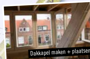
Dakkapel maken + plaatsen

GEEN KLUS IS ONS TE GEK, OFTEWEL: BIJ RADEK LEGAL MOET JE ZIJN!